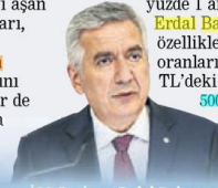
İSO Başkanı Erdal Bahçivan

Faizdeki düşüş ve yeniden yapılandırmaların etkisiyle İSO 500'ün finansman giderleri geçen yıl yüzde 33,4 düşüşle 64 milyar liraya indi. İSO 500'de kâr eden kuruluş sayısı 381'den 411'e yükselirken, İSO 500'ün istihdamı da 2019'da yaklaşık yüzde 1 arttı. İSO Başkanı Erdal Bahçivan, "2019'un özellikle ikinci yarısında, faiz oranlarındaki düşüşler ile TL'deki görece istikrar, İSO 500 için 2018'e göre daha olumlu mali koşullar yarattı" dedi.