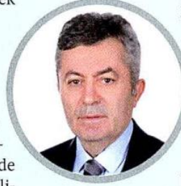
TKSD Başkanı Haluk Erceber