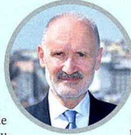
İTO Başkanı Şekib Avdağ

İstanbul Ticaret Odası (İTO) Başkan Şekib Avdağ, 2021'i pandemiyle birlikte iş yapma kabiliyetlerini geliştirdikleri bir yıl olarak yorumluyor. Avdağ, "Küresel çapta da talep arttı. Bu talep artışını fırsata çeviren ülkelerin başında da Türkiye geliyor. İmalat sanayi genelinde kapasite kullanımı Temmuz 2021'de yüzde 76,7 ile 1,5 yılın zirvesine ulaştı. 2021'in ilk çeyrek büyüme verilerinde de makine ve teçhizat yatırımlarında yüzde 30,5'lik artış dikkat çekmişti" diyor. Diğer yandan Türkiye'nin küresel ihracattan aldığı payın, yıl bitmeden ilk kez yüzde 1'in üzerine çıkması bekleniyor. Bu payın 2020'de yüzde 0,96 seviyesinde olduğunu hatırlatan Avdağ, bunun ikinci önemli eşik olduğunun altını çizerek psikolojik sınırın geçildiğine dikkat çekiyor: "Şimdi tüm ihracatçılar olarak kısa vadeli ilk hedefimiz bu payı, yüzde 1,5'a çıkarmak olmalı. Rakamlar gösteriyor ki iş dünyamız 2021'de daha çok üretti, daha çok yatırım yaptı ve daha çok uluslararası arenada boy gösterdi. Türk sanayisi için önemli bir başarı. 2022'de bu artış ivmesinin süreceğine inanıyoruz."