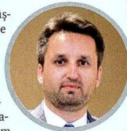
PAGDER Başkanı Selçuk Gülsün

ği 2020'nin nisan, mayıs ve kısmen haziran aylarındaki düşük performanstan kaynaklanan baz etkisinin de katkı sağladığına işaret ediyor. Sektörde geçen yılki yüzde 66-67 kapasite kullanım oranlarına kıyasla, bu yıl yüzde 70'in üzerinde ki seviyelere çıkılması bekleniyor. Önümüzdeki döneme ilişkin ise Tosyalı, "2022'yi, yassı ürün kapasitesinde yaklaşık 4 milyon ton civarında artışın söz konusu olduğu, ihracatımızın bu yeni artışlar, yeni kapasiteler ve yeni üretimler sayesinde, gelişme sürecine gireceği, yüzde 10 civarında üretim ve ihracat artışının söz konusu olacağı bir yıl olarak görüyoruz" diyor.