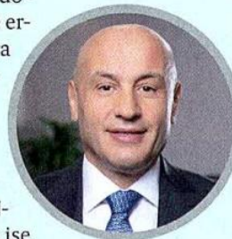
İHKİB Başkanı Mustafa Gültepe