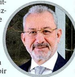
TÇÜD Başkanı Fuat Tosyalı