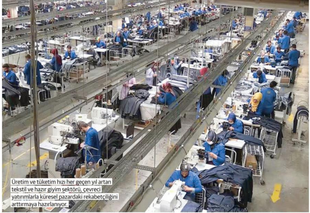
Üretim ve tüketim hızı her geçen yıl artan tekstil ve hazır giyim sektörü, çevreci yatırımlarla küresel pazardaki rekabetçiliğini arttırmaya hazırlanıyor.

İklim değişikliğinin etkilerini günlük hayatında artık daha fazla hisseden tüketiciler, alışveriş tercihlerini özellikle tekstil ve hazır giyim sektöründe bu bilinçle şekillendiriyor. Çevre duyarlılığı artan tüketiciler daha az kirlilik yaratan, atıkları azaltan, daha fazla geri dönüşüm sağlanan, yenilenebilir kaynakları daha fazla kullanan markaları tercih ediyor. GreenPrint'in Sürdürülebilirlik İş Endeksi'ne göre Y Kuşağının %75'i ile Z Kuşağının %63'ü ve X kuşağının %64'ü çevresel açıdan sürdürülebilir bir ürün için daha fazla ödemeye isteklidir. Tüketicilerin çevre konusunda artan farkındalıkları ve endişeleri satın alma kararlarını etkiliyor.