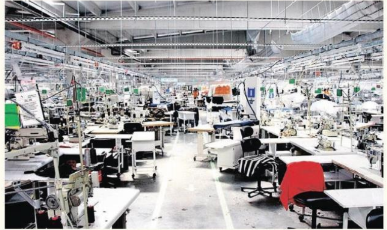
Yükselen dolar kuru ve enflasyon, bütçe dönemine giren holding ve şirketlerin 2022 hedefleri için büyük bir zorluk yaratıyor.