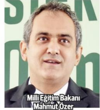
Milli Eğitim Bakanı Mahmut Özer

Buradaki her bir fidan bir öğrencimizi temsil ediyor. 81 ilde eğitim verdiğimiz tüm alanlarda sektörlerle işbirlikleri kurmaya, mesleki eğitimi yeniden şekillendirmeye başladık. İnşallah bu atılan adımlarla artık Türkiye'deki kronik bir problem olan genç işsizlik oranını tedrici, suhuletli bir şekilde emin adımlarla düşüreceğiz ve meslek liseleriyle birlikte geleceğin güçlü Türkiye'sinin inşasında çok önemli bir mesafeyi hep birlikte alacağız." AA