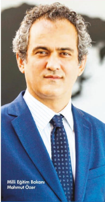
Milli Eğitim Bakanı Mahmut Özer

Milli Eğitim Bakanı Mahmut Özer, Çatalca'da ISO Gelecek Meslek Liselerinde Hatıra Ormanı'nda fidan dikimine katıldı. Törende konuşan Özer, "Türkiye'deki kronik bir problem olan genç işsizlik oranını emin adımlarla düşürecek ve meslek liseleriyle geleceğin güçlü Türkiye'sinin inşasında çok önemli bir mesafeyi hep birlikte alacağız" dedi