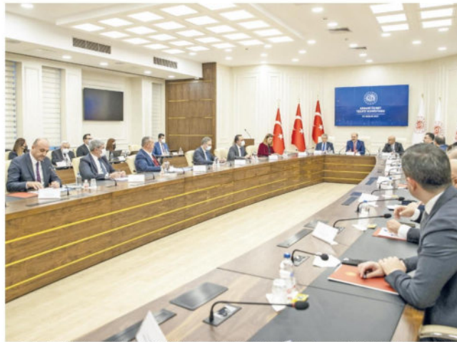
Asgari Ücret Tespit Komisyonu, 2022 yılı için ücretleri belirlemek amacıyla önceki gün, hükümet, işçi ve işveren temsilcileri ile ilk toplantısını gerçekleştirdi.

Ülkemizi koruyalım, milletimizi ve ekonomik refahımızı düşünelim de kişisel menfaatlerimizi de mudarebe sistemi, altın, gayr-ı menkul ve helâl hisse senedi alımı gibi yollarla koruyalım. Böylece gavur menşeli veya gavurlaşan ekonomik sistemimizden kaynaklı Döviz depremlerinin yıkımına uğramayalım. Aslında korunmamamız gereken kanımızı emen sistemimiz olduğunu bilelim,