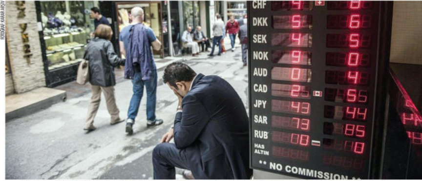
Enflasyonun Aralık ayı ve 2022'nin ilk çeyreğinde yükselişini hızlandırması beklenen faizin indirilmesiyle TL'deki negatif getiri oranının artması bekleniyor. Şu anda faiz enflasyonun 7 puan altında.