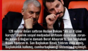
128 milyar doları sırtından Hazine Bakanı "Atıl izli izine karıştı" diyerek sosyal medyadan iktisatçıların düğümüne zorunda kalan Erdoğan'ın damadı Berat Albayrak'ın. Son başbakan Binali Yıldırım'dı. Son Başbakan Binali Yıldırım veda etmiş, başbakanlık kalkmış, cumhurbaşkanlığı sistemine geçilmişti.

de bizim Merkez Bankamızın döviz rezervini yükseltmeyecek. Biz yükselteceğiz, bundan hiç endişeleniz olmasın. Bizim kasamız boş değil, kasa mevcudumuz gayet iyi. Türkiye'ye karşı oynanan oyunun en etkili silahı haline gelen döviz kurunu dengeye oturtmak da fiyatları makul seviyede tutmak da bizim elimizdedir. Bize inanan, bize güvenen her vatandaşımızı da seferberlik ruhuyla ülkemizin geleceği yarın asrının, bir asrının belirleyicisi bu vizyona sahip çıkmaya davet ediyoruz."