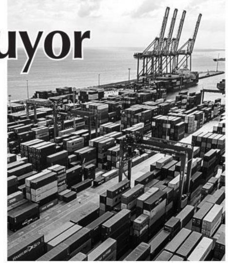
İmalat sektöründe ihracat pazarlarında iyileşme olsa da sınırlı.

"İhracat talep koşullarının ilk çeyrek sonunda dirençli seyrini korumasına rağmen Ukrayna'daki savaşın iş dünyasında güven kaybı, fiyat artışları ve tedarik zinciri aksamaları gibi geniş çaplı etkileri, yılın ikinci çeyreğinde imalatçıların ihracat imkânlarını sınırlama potansiyeline sahip." • Ekonomi Servisi