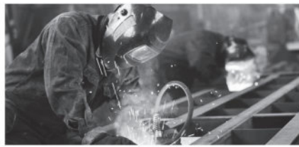
Yedi sektörde girdi maliyetlerindeki artış hız keserken yine aynı sayıda sektörde nihai ürün fiyatları enflasyonu geriledi.

değer kaybı ve Ukrayna'daki savaş maliyet yüklerini artırırken petrol, doğalgaz ve deniz taşımacılığı fiyatları yükseldi. Bunun sonucu olarak, imalatçıların nihai ürün fiyatlarını belirgin şekilde artırmak durumunda kaldı. Ham maddeler çirsinde genele yaygın zorluklar yaşanırken tedarikçilerin teslimat süreleri uzadı. Söz konusu artış güçlü düzeyde olsa da son yedi ayın en düşük oranında gerçekleşti. Malzeme teminindeki zorluklar, artan maliyetler ve kırılan talep, nisan ayında satın alma faaliyetlerini yanı sıra girdi ve nihai ürün stoklarını azalışına etkili oldu. Firmaların operasyonel kapasitelerini genişletmek amacıyla üst üste 23. ay istihdam artırmama, anketin görece olumlu tarafı olarak öne çıktı. İstihdam artışı ilmi düzeyde ancak mart ayına göre hafif daha yüksek hızda gerçekleşti. Ekonomist Firuze Nazlı Ergin "Nisan'da ilave düşüşle 49,2'ye gerileyen PMI, eşik değerinin altında kalmaya devam ediyor. İmalat Sanayi üretimi 5 aydır yavaşlıyor. İhracatta ise son 3 aydır ilk kez yavaşlama kaydedildi. 10 sektörün 6'sında üretim eşik değerinin altında. Sürdürülemez politikaların sonucu. Sürpriz yok" dedi. -EKONOMİ SERVİSİ