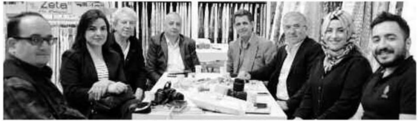
Fuara katılan basın mensupları Bursa stantlarını ziyaret etti.

İTO Başkanı Şekib Avdağ ise ev tekstil sektörünün daha fazla ihracat potansiyeli olduğuna dikkati çekerek, 3,5 milyar dolarlık ihracatın sektörün potansiyelini yansıtmadığını, sektörün tüm paydaşlarıyla beraber iki sene sonra yapılacak fuarda 6,5-7 milyar dolar ihracatın konuşulacağına inandığını söyledi. Fuarın bu yıl yeni bir heyecanla başladığını belirten Avdağ, "Öncelikle TETSİAD ve BTSO ile beraber inanılmaz bir iş birliği içinde bir süreç yürüttük. Daha önce yirmi beş yıl devam eden ama ciddi sıkıntılar yaşadığımız bir süreçten sonra bu fuar adeta küllerinden doğdu. Yeni bir logoya, yeni bir isimle, yeni bir ruhla, yeni bir organizatörle yoluna devam ediyor. Şimdi bu vizyonu gerçekten çok başarılı bir sonucunu görüyoruz." şeklinde konuştu.