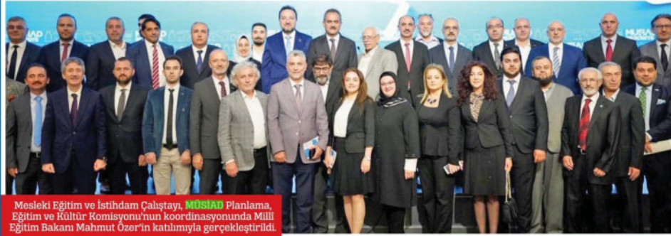
Mesleki Eğitim ve İstihdam Çalıştayı, MÜSİAD Planlama, Eğitim ve Kültür Komisyonu'nun koordinasyonunda Millî Eğitim Bakanı Mahmut Özer'in katılımıyla gerçekleştirildi.

S anayinin can damarı olan meslek liseleri sadece kalifiye eleman yetiştirmekle kalmıyor ihracat da yapıyor. MÜSİAD Planlama, Eğitim ve Kültür Komisyonu tarafından düzenlenen Mesleki Eğitim ve İstihdam Çalıştayı'nda konuşan Millî Eğitim Bakanı Mahmut Özer, İstanbul Sanayi Odasının (İSO) iş birliğiyle eğitim verdikleri lisede kâğıt havlu üretildiğini, bunun yanında kâğıt havlu makinesinin de aynı lisede üretildiğini belirtti. Özer, artık meslek liselerinin yurt dışına ihracatla birlikte TEKNOFEST gibi organizasyonlarda önemli projeler geliştiren okullar hâline geldiğini de ifade etti.