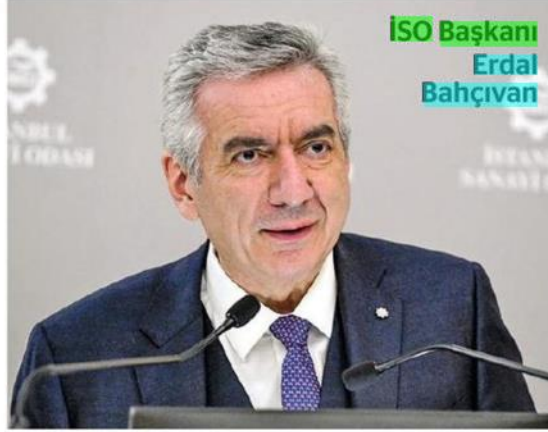
ISO Başkanı Erdal Bahçivan