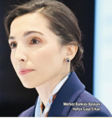
Merkez Bankası Başkanı Hafize Gaye Erkan