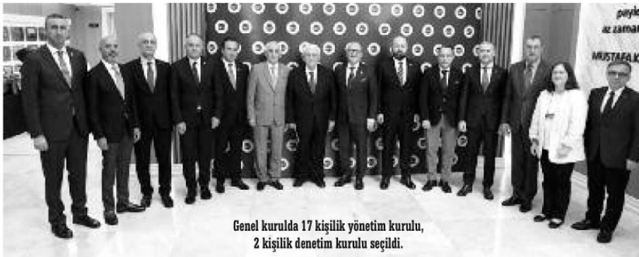
Genel kurulda 17 kişilik yönetim kurulu, 2 kişilik denetim kurulu seçildi.