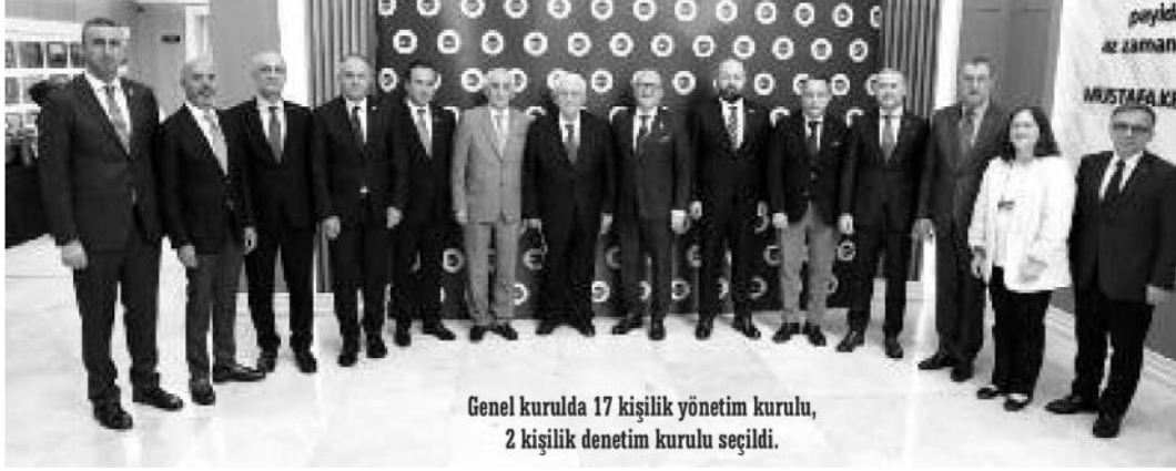
Genel kurulda 17 kişilik yönetim kurulu, 2 kişilik denetim kurulu seçildi.