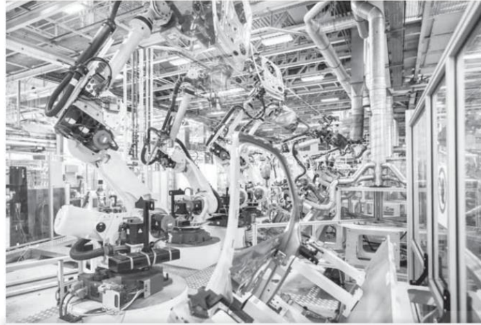
İmalat PMI, Temmuz 2023 (>50 = Gecen aya göre iyileşme)