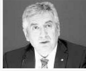
Istanbul Sanayi Odası Başkanı Erdal Bahçivan