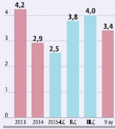
Yıllar itibarıyla büyüme oranı