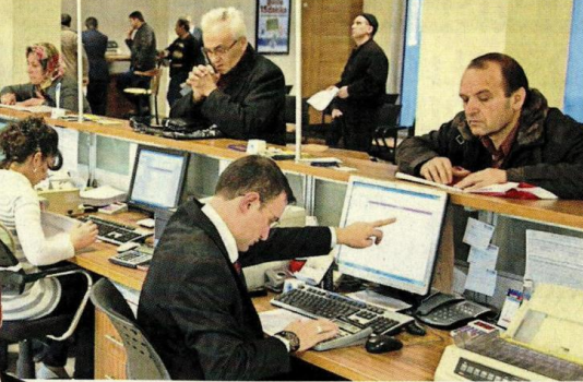
Rıdvan Yıldız Bankalar hesap işletim ücretlerinden yılda 10 milyar lira civarında gelir elde ediyordu. Danıştay haksız yere alınan bu ücretlere 'Dur' dedi.