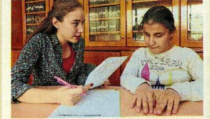
Görme engellilerin ses, koku ve zemin değişikliklerini iyi kullanması, nesnelere ayırt etmek için dokunsal ipucu yakalaması gerekiyor.

İstanbul Sanayi Odası (İSO) Başkanı Erdal Bahçivan , işçi-işveren ilişkileri ve çalışma hayatı ile ilgili hukuki sorunlara değindi. İş davalarının çoğunlukla işveren aleyhine bittiğini, yargıların, "güçlü karşısında güçsüzün korunması" ilkesinden yola çıkarak çalışana koruma eğiliminde olduğunu dile getiren Bahçivan, "İşverenler davalarda yüzde 99 haksız kabul edilerek zarara uğrattılıyor. İş davalarında amaç adaleti sağlamak olmalı" dedi.