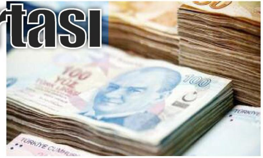
Halkın tepkisini çeken bu uygulama, hükümetin vaatleri doğrultusunda TBMM Genel Kurulu'nda görüşülen torba yasayla değiştirildi. Ancak yapılan bu değişiklik gençlerin sorununu çözmekten uzak kaldı.

Okuldan yeni mezun olan gençler uzun süre iş bulamadıkları halde, bir de GSS primi ödemek zorunda kalıyorlar. Prim ödemeyenler ise sağlık hizmeti alamıyorlar. Halkın tepkisini çeken bu uygulama, hükümetin vaatleri doğrultusunda TBMM Genel Kurulu'nda görüşülen torba yasayla değiştirildi. Ancak yapılan bu değişiklik gençlerin sorununu çözmekten uzak kaldı. Çünkü, getirilen düzenleme, sadece okulumu hiç uzatmadan tam zamanında bitiren gençlerin mağduriyetini önleyecek. Yapılan