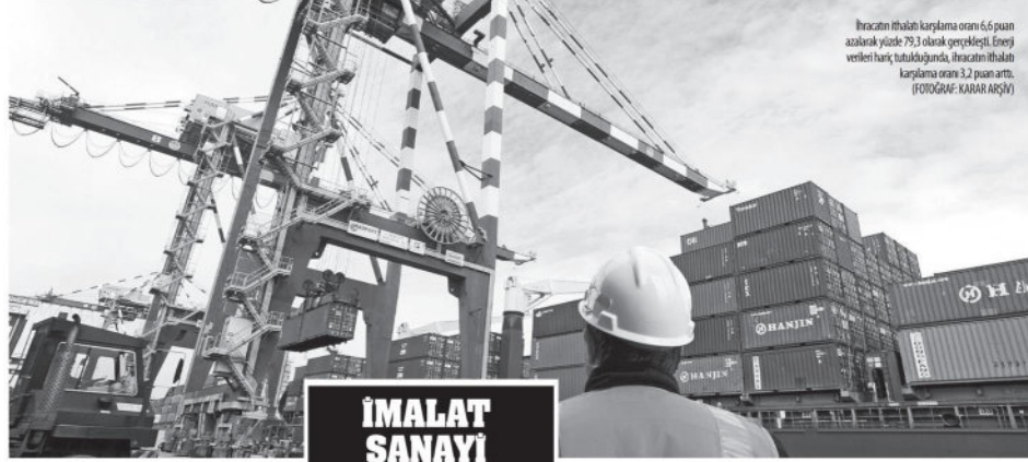
Ihracatın ithalat karşılama oranı 6,6 puan azalarak yüzde 79,3 olarak gerçekleşti. Enerji verileri hariç tutulduğunda, ihracatın ithalat karşılama oranı 3,2 puan arttı.

Ocak-Nisan döneminde geçen yılın aynı dönemine göre ihracat, yüzde 21,7 oranında artarak 83,5 milyar dolar, ithalat, yüzde 40,1 oranında artarak 116,7 milyar dolara çıktı. Dış ticaret hacmi 200 milyar dolara dayandı. Dış açık 32,5 milyar dolara çıktı. Ticaret Bakanı Muş, yeni bir rekorun kırıldığını paylaşırken, yüksek teknolojili ürün ihracatında düşüş kaydedildi.