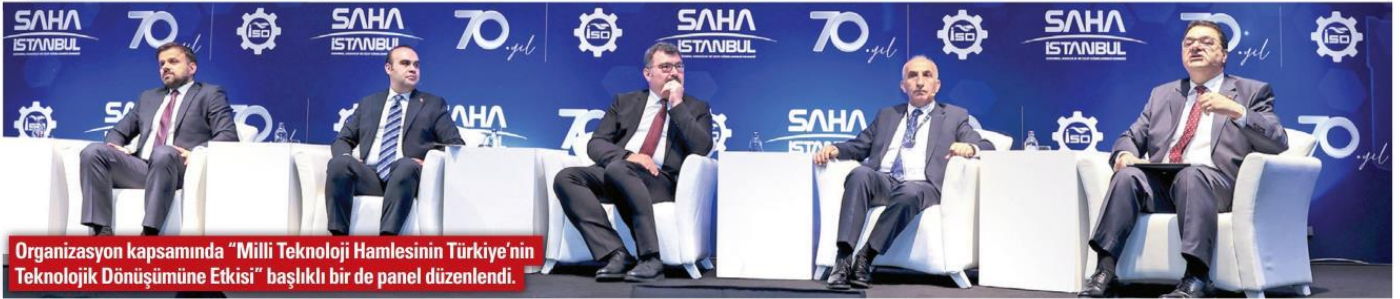
Organizasyon kapsamında "Milli Teknoloji Hamlesinin Türkiye'nin Teknolojik Dönüşümüne Etkisi" başlıklı bir de panel düzenlendi.

SİPARİŞ ORANI ÖNCEKİ YILA GÖRE YÜZDE 40 ARTTI