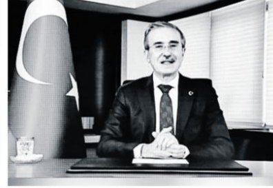
Etkinliğe online olarak katılan Savunma Sanayi Başkanı İsmail Demir, sektörün Ar-Ge harcamalarının, önceki yıla göre yüzde 32 artarak yaklaşık 1 milyar 600 milyon doları geçtiğini söyledi.

40 artarak yaklaşık 9 milyar dolar olarak gerçekleştiğinin altını çizen İsmail Demir, "Sektörün Ar-Ge harcamaları ise önceki yıla göre yüzde 32 artarak yaklaşık 1 milyar 650 milyon dolara yükseldi. Yılsonunda bu rakamların daha yukarılarda olmasını hedefliyoruz" dedi.