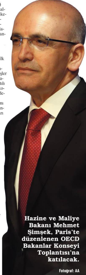
Hazine ve Maliye Bakanı Mehmet Şimşek, Paris'te düzenlenen OECD Bakanlar Konseyi Toplantısı'na katılacak.

Türkiye Sektörel PMI raporu, nisan ayında da imalat sektöründe yakın dönemde gözlenen eğilimlerin sürdüğünü işaret etti. Takip edilen on sektörün çoğunluğunda üretim ve yeni siparişler zayıflarken, istihdam tarafında nispe-