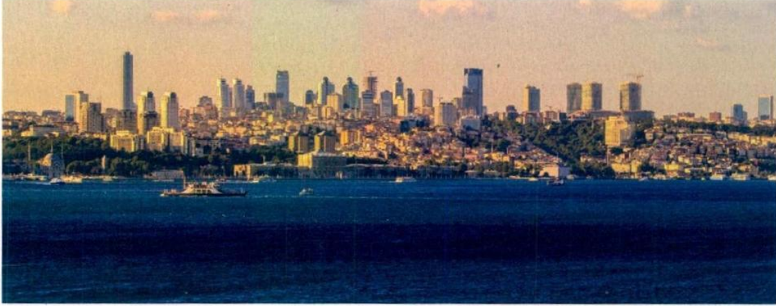
İpek yolu'nun en büyük menzili, Doğu ve Batı arasındaki ticaretin ana üssü ve medeniyetlerin göz bebeği olan İstanbul, günümüz Türkiye'sinin kalbi olmayı sürdürüyor. Bugün İstanbul'dan kalkan bir uçak, sadece 4 saatlik uçuşla tam 56 ülkeye ulaşıyor.

"Söz konusu noktada şehrin sahip olduğu bu stratejik konum; finansman ticarete, üretimden turizme kadar pek çok alanda da kendisini hissettiriyor. İstanbul, yoğun bir nüfusa sahip. Bir kilometrekareye 2 bin 700 civarında insan düşüyor."