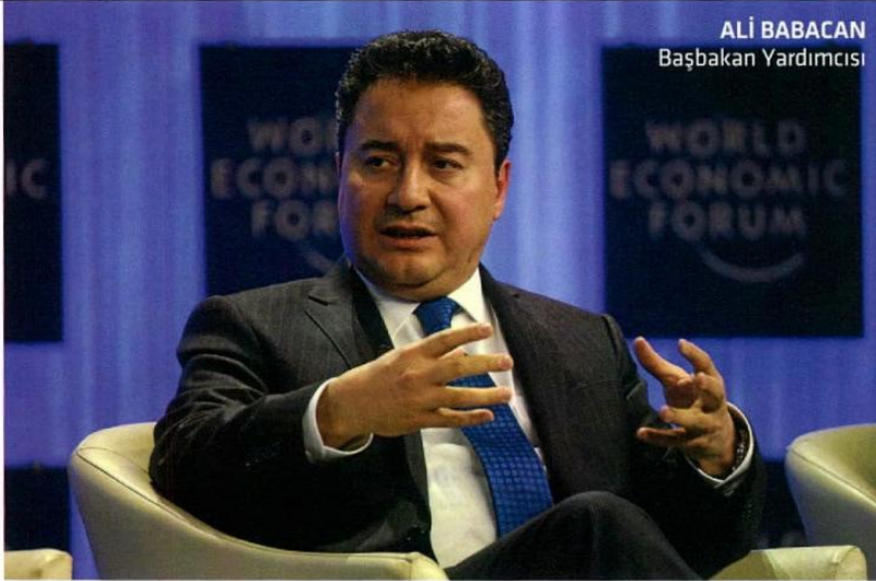
ALİ BABACAN Başbakan Yardımcısı

◀ Başbakan Yardımcısı Ali Babacan, Türkiye ekonomisinin içinde bulunduğu durumu tedavi reçetesini yazdı: "İnşaattan sanayiye yönelmeliyiz."