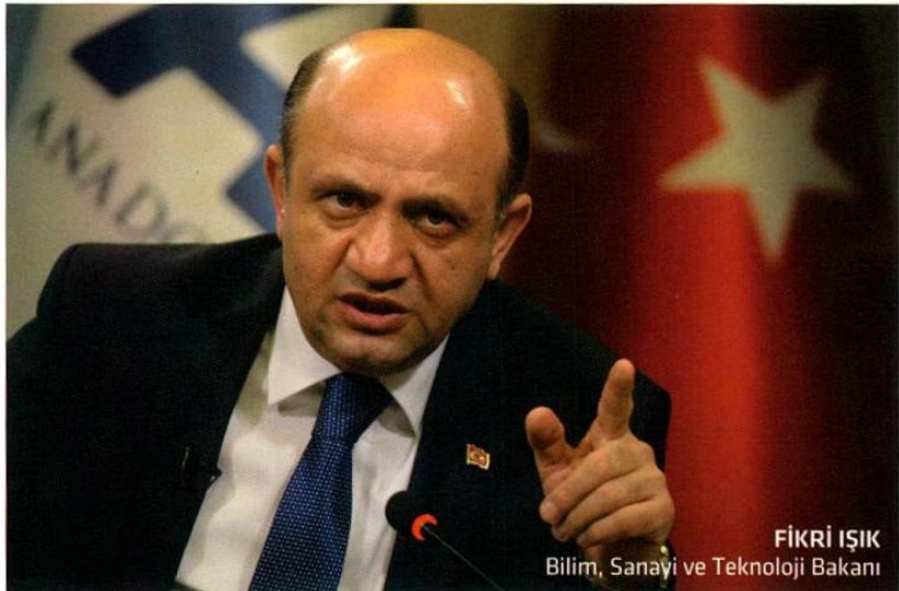
FİKİRİ İŞİK Bilim, Sanayi ve Teknoloji Bakanı

Türkiye'de ikinci çeyrek sonunda ortaya çıkan veriler, inşaatteki üretimin yaklaşık aynı düzeyde seyrederken, satışlarda önemli bir azalma olduğunu söylüyor. İnşaat sektöründe istihdam ve çalışılan saat süreleri de geriliyor.