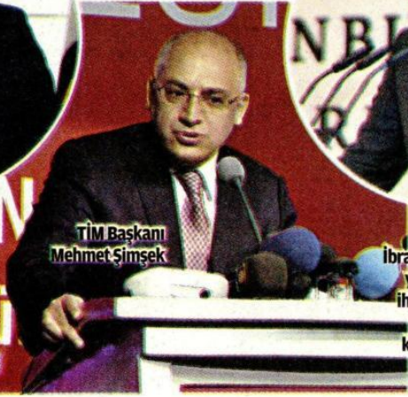
TİM Başkanı Mehmet Şimşek

İSO Başkanı Erdal Bahçivan, uluslararası piyasalarda petrol fiyatlarının düşmesinin Türkiye için büyük bir avantaj olduğunu söyledi.