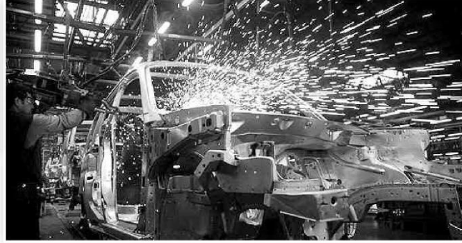
İş dünyası risklerin devam ettiğini belirterek 2015 yılında da temkinli olunması gerektiğine dikkat çekti.