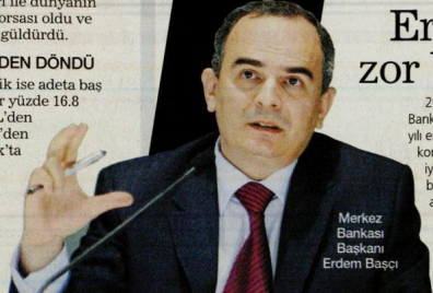
Merkez Bankası Başkanı Erdem Başçı

2015'i zor geçirecekler içinde hiç kuşkusuz Merkez Bankası Başkanı Erdem Başçı geliyor. Ekim sonunda "2015 yılının enflasyonla mücadele yılı olacak" diyen Başçı'nın bu konuda elini 60 doların altına inen petrol fiyatları iyiden iyine rahattı. Buna karşın, siyasetlerden yeniden başlayan "faiz indir" baskılarının seçimler yaklaştıkça artacağı düşünüldüğüne Başkan Başçı için pek rahat bir yıl olacağı söylenemez. Üstelik aynı dönemde FED'in faiz artırımına başlayacağı düşünüldüğünde 2015'te Merkez Bankası kararları ekonomide ana gündem maddesi olacağı beşniyor.