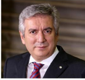
ERDAL BAHCIVAN İstanbul Sanayi Odası Başkanı