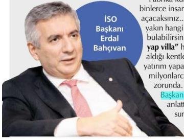
İSO Başkanı Erdal Bahçivan

Fabrika kuracak, yüzlerce, binlerce insana iş kapısı açacaksınız... İlgücü piyasasına yakın hangi bölgede uygun arazi bulabilirsiniz? "Yap gökdelen, yap villa" hayalinin esir aldığı kentlerde sanayici nasıl yatırım yapacak? Daha kafadan milyonlarca doları arsaya gömmek zorunda. Çözümü basit. İSO Başkanı Erdal Bahçivan anlattı. Hükümete bir öneri sunmuşlar. Demişler ki: "Arazilerin büyük