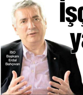
ISO Başkanı Erdal Bahçivan