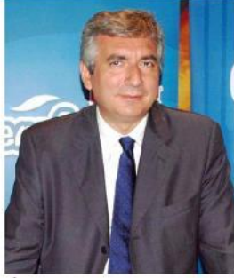
I stanbul Sanayi Odası (ISO) Yöne- tim Kurulu Başkanı