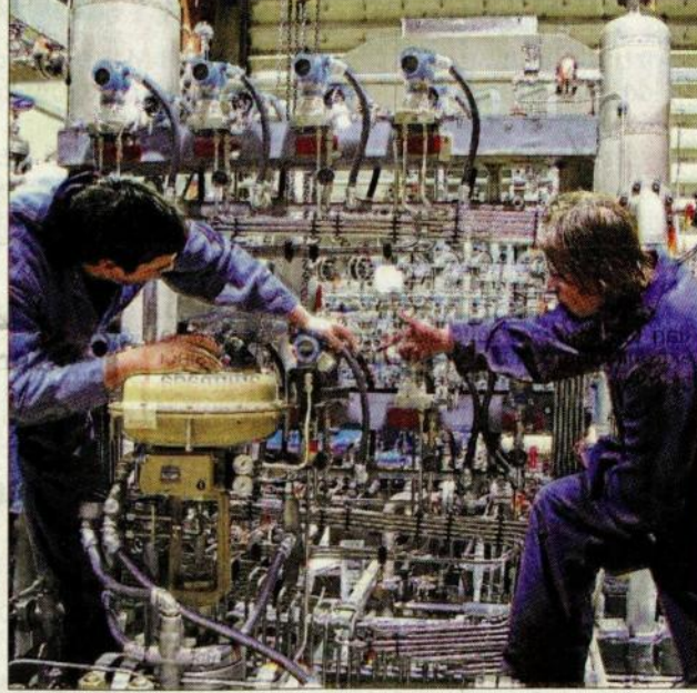
Istanbul imalat sanayiinde, yeni siparişlerdeki düşüşe bağlı olarak üretim ve satın alma faaliyetleri de düştü.

Eylül sonuçlarına göre; Türkiye geneli imalat sanayi satın alma verisi de Eylül'de 48.8'de kaldı. Bu veri, Türk imalat sektöründe de bozulmanın sürdüğünü gösterdi. Çalışmadaki en dikkat çekici durum İstanbul imalatçıların yeni siparişlerindeki keskin düşüş. Yeni siparişlerdeki düşüş iş hacmindeki düşüşü de hızlandırdı. Firmalar, bu durumu durgun piyasa ile siyasi ve ekonomik belirsizliğe dayandırıyor.