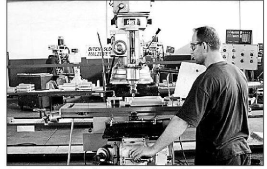
İmalat sektöründe üretim Eylül'de 49.9'dan 46.8'e gerileyerek Nisan'dan bu yana en sert daralmayı kaydetti.

san'dan bu yana en sert daralmayı kaydetti. Yeni siparişler endeksi ise 49.6'dan 48.6'ya geriledi. İki alt endeks de dokuz aydır daralmaya işaret eden 50 seviyesinin altında yer alıyor. Şirketlerin ankete verdikleri cevaplara göre üretim ve yeni siparişlerdeki daralma zayıf piyasa koşulları ile siyasi ve ekonomik belirsizlikten kaynaklanıyor. Kur hareketlerinin yarattığı maliyet ise üretim üzerinde ek baskı yaratıyor.