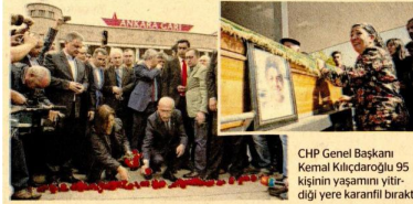
CHP Genel Başkanı Kemal Kılıçdaroğlu 95 kişinin yaşamını yitirdiği yere kararlı bıraktı.

Ankara'da önceki gün gerçekleştirilen bombalı saldırılarda yaşamını yitiren 95 kişi Sıhhiye Meydanı'nda anılırken iş dünyası temsilcilerinden teröre karşı "kararlı duruş, birlik, beraberlik ve kenetlenme" çağrısı geldi.