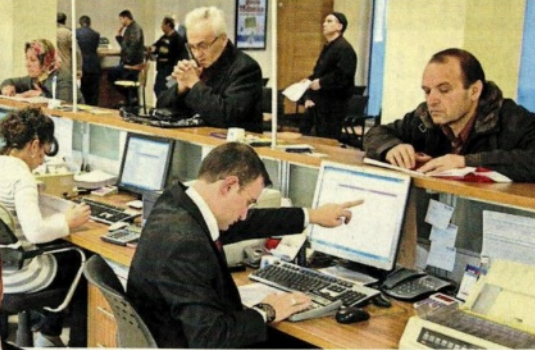
Rıdvan Yıldız Bankalar hesap işletim ücretlerinden yılda 10 milyar lira civarında gelir elde ediyordu. Danıştay haksız yere alınan bu ücretlere 'Dur' dedi.