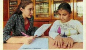
Görme engellilerin ses, koku ve zemin değişikliklerini iyi kullanması, nesnelere ayırt etmek için dokunsal ipucu yakalaması gerekiyor.

İstanbul Sanayi Odası (İSO) Başkanı Erdal Bahçivan , işçi-işveren ilişkileri ve çalışma hayatı ile ilgili hukuki sorunlara değindi. İş davalarının çoğunlukla işveren aleyhine bittiğini, yargıçların, 'güçlü karşısında güçsüzün korunması' ilkesinden yola çıkarak çalışanı koruma eğiliminde olduğunu dile getiren Bahçivan, "İşverenler davalarda yüzde 99 haksız kabul edilerek zarara uğrattılıyor. İş davalarında amaç adaleti sağlamak olmalı" dedi.