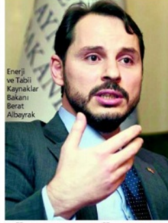
Enerji ve Tabii Kaynaklar Bakanı Berat Albayrak

ANKARA'da önceki akşam yaşanan, 28 şehit verdiğimiz terör saldırısının ardından ekonomi dünyasından mesaj yağdı: