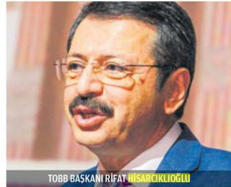
TOBB BAŞKANI RİFAT HİSARÇIKLIOĞLU