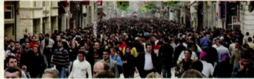
BAŞBAKAN YARDIMCISI MEHMET ŞİMŞEK:

2015 yılında kişi başına GSYİH, önceki yıla göre 2 bin 398 lira artarak 25 bin 130 liraya yükseldi. Buna karşılık kur artışının da etkisiyle kişi başına düşen milli gelir ise bin 134 dolar azalarak 10 bin 395 dolara, 9 bin 261 dolara düştü. Böylece kişi başına düşen milli gelir 5 yıl aradan sonra yeniden 10 bin doların altına immiş oldu. Yüzde 4,8'lik küçülmenin yaşandığı 2009 yılında 8 bin 559 dolara gerileyen milli gelir, 2010'de 10 bin 21 dolar, 2011'de 10 bin 469 dolar, 2012'de 10 bin 497 dolar, 2013'te 10 bin 807 dolar ve 2014 yılında ise 10 bin 395 dolar olmuştur. 2015'te sabit fiyatlarla mal ve hizmet ihracatı 0,8 puan azalırken, mal ve hizmet ithalatı yüzde 0,3 artış gösterdi.