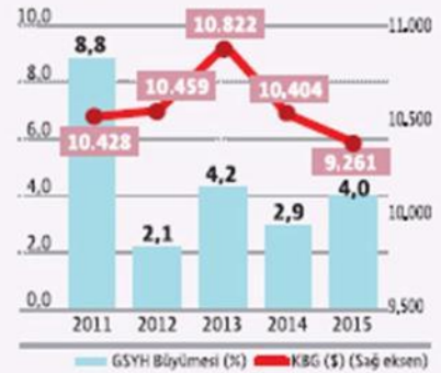
Büyüme ve kişi başı gelir

ki yüksek artış nedeniyle 2015'te 9 bin 261 dolara geriledi. Geçen yılı tarım yüzde 7.6, hizmetler sektörü yüzde 4.8, sanayi yüzde 3.3 büyümeyle kapattı. GSYH 2015'te cari fiyatlarla 1 trilyon 953 milyar lira ya çıkarırken, döviz cinsinden hesapla 719 milyar 967 dolara geriledi. TÜİK, 2015'in dördüncü çeyrek büyümesini ise yüzde 5.71 olarak açıkladı. HÜSEYİN GÖKÇE/21