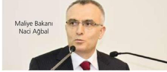
Maliye Bakanı Naci Ağbal