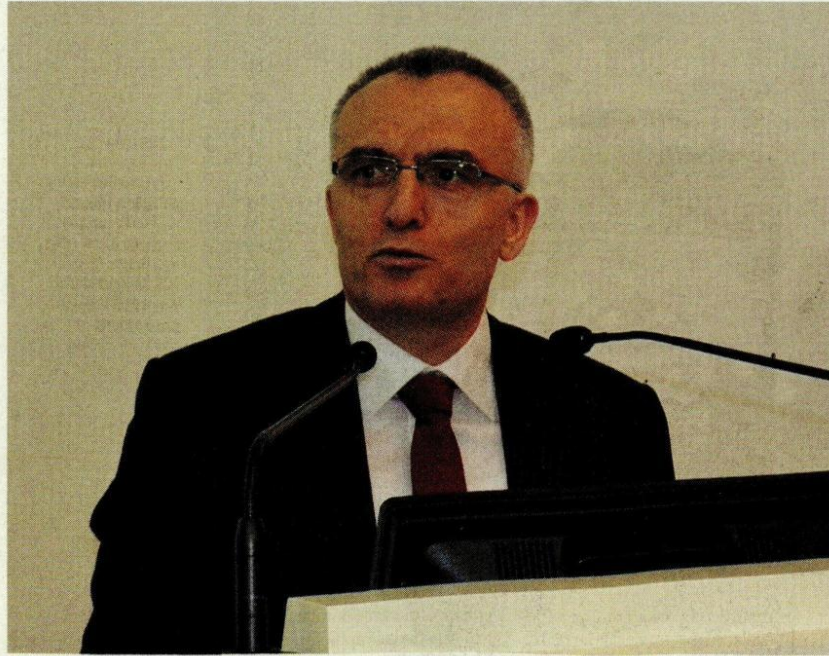
Maliye Bakanı Naci Ağbal, "İnşallah memurlarımızın sosyoekonomik durumları AK Parti hükümetleri döneminde her zaman iyi olmuştur." dedi.

Agbal, Gelir İdaresi Başkanlığı'nın (GİB) yayınladığı tebliğle ilgili basında yer alan haberlere yönelik, "Yapılan düzenlemenin hiçbir yeni tarafı yok. Mevcut kanunlar çerçevesinde zaman aşımı süresiyle ilgili yapılan bir açıklamadır. Dolayısıyla bugün vergi borçlarının 5 yıl içerisinde, biz ona 'tahsilat zaman aşımı' diyoruz, bu konuya açıklık getiren, uygulamayı yönlendiren bir tebliğ. Dolayısıyla o tebliğ düzenlemesinin yeni getirdiği hiçbir yanı yoktur. Vergisini ödeyen için de ödemeyen için de geçerli bir kural." bilgilerini verdi. İSTANBUL AA