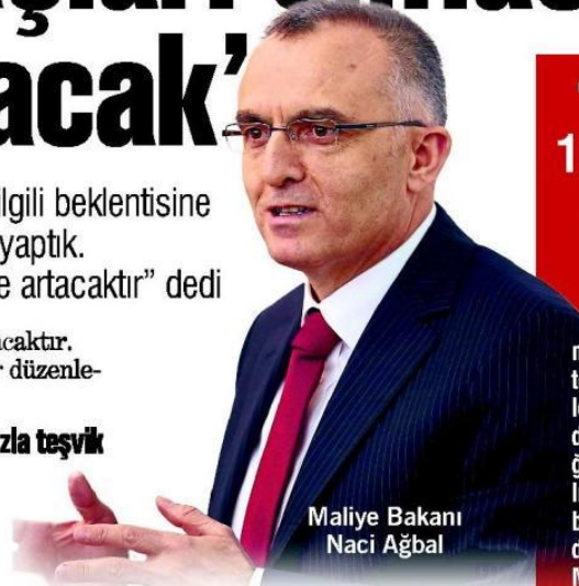
Maliye Bakanı Naci Ağbal

Maliye Bakanı Ağbal, toplantıda yaptığı konuşmada da şunları kaydetti: "Dünyanın ekonomik ve jeopolitik kırılganlık içinde olduğu bir dönemde 1 Kasım seçimleri ile siyasi istikrarın sağlanmış olması hakikaten önemlidir. Dünyanın içinde bulunduğu koşullara baktığımız zaman denizin durgun olamadığını görüyoruz. Deniz dalgah. Böyle bir dönemde bizim siyaset ve ekonomi gemisinin sağlam, sürdürülebilir ve reform gündemi içinde olması önemli. 1