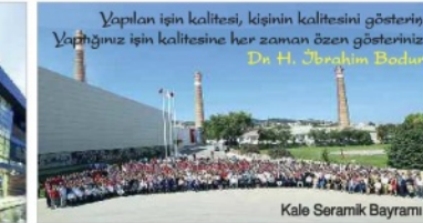
Kale Seramik Bayramı