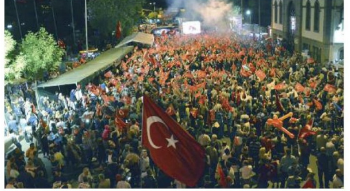
Kurtuluş Savaşı'nı gerçekleştiren "Gazi Meclis'in, bağımsız Türkiye Cumhuriyeti'nin temellerinin atıldığı, millet iradesinin temsil edildiği güzide bir kurum olduğunu vurgulayan Bahçivan, "TBMM bütün sorunların yegane meşru çözüm yeridir" diye ekledi.

dan sakınarak; provokatif çağrılara ve tahriklere itibar etmemelidir. Öte yandan; devlet kurumlarına ve özellikle de milletimizin göz bebeği olarak kabul edilen Türk Silahlı Kuvvetlerimize duyulan güveni yıpratacak her türlü söz ve davranıştan sakınmalıyız. Çok acı bir olay yaşadık, ama bu olay karşısında vatanımıza duyduğumuz bağlılık kat be kat artarak, birbirimize kenetlenerek tek yürek olmayı bir kere daha başardık. Millet iradesine ve demokrasiye kast edenlere karşı hangi görüşte olursak olalım, hep birlikte el ele sergilediğimiz birlik, beraberlik ve dayanışma bugün olduğu gibi bundan sonra da mutlaka devam etmelidir." dedi