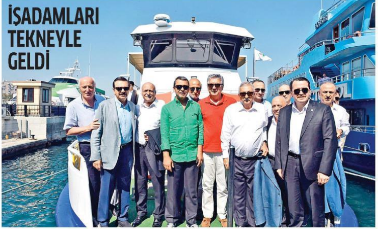
İş dünyası, işçi-memur ve çiftçilerin üye olduğu sivil örgütlerin başkanları buluşup Yenikapı'daki miting alanına aynı tekneye geçtiler.