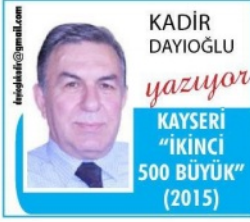
KADİR DAYIOĞLU yazıyor KAYSERİ "İKİNCİ 500 BÜYÜK" (2015)

İstanbul Sanayi Odası'nın (İSO) "Türkiye'nin İkinci 500 Büyük Sanayi Kuruluşu" araştırmasının 2015 yılı sonuçlarını açıkladı. Buna göre; "İkinci 500" de ilk sırayı, 223,7 milyon liralık "üretimden net satışı" ile Emas Makina (Manisa) aldı.