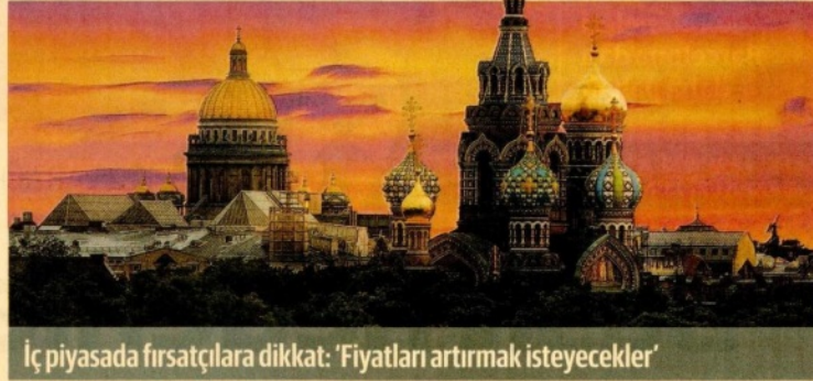
İç piyasada fırsatlara dikkat: 'Fiyatları artırmak isteyecekler'