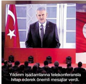
Yıldırım işadamlarına telekonferansla hitap ederek önemli mesajlar verdi.

15 Temmuz gecesinin, çok karanlık bir gece olduğunu hatırlatan Yıldırım şöyle konuştu: "15 Temmuz gecesinde Türkiye büyük bir uçurumun eşiğinden döndü. Ülkemizin geleceğine kastedenler, demokrasisini yok