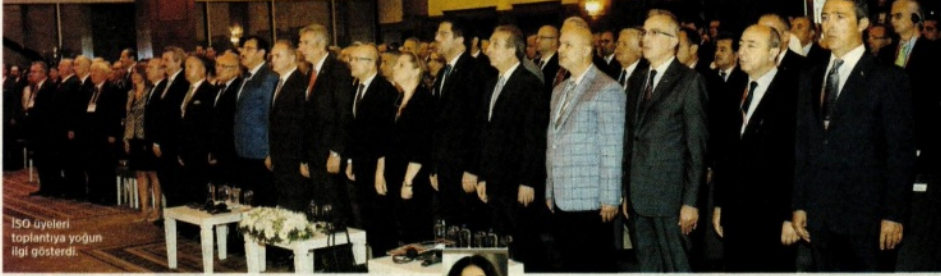
ISO üyeleri toplantıya yoğun ilgi gösterdi.

Türkiye'de uzun yıllardan bu yana iş yapan uluslararası şirketlerin ülke ve bölge yöneticileri, tek bir sesle 15 Temmuz'daki darbe girişiminden sonra projelerine ara vermediklerini duyurmak adına dün İstanbul Sanayi Odası'nın (ISO) düzenlediği etkinlikte bir araya geldi. Patronlar ve firma yöneticileri Türkiye'nin