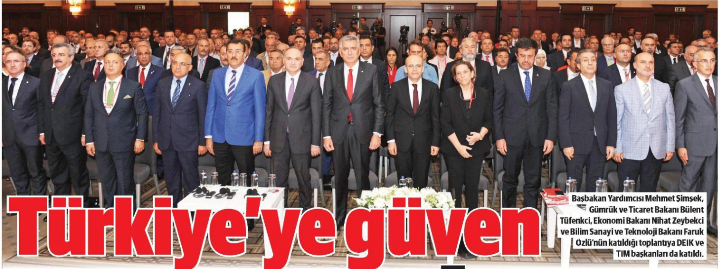
Başbakan Yardımcısı Mehmet Şimşek, Gümrük ve Ticaret Bakanı Bülent Tüfenkci, Ekonomi Bakanı Nihat Zeybekci ve Bilim Sanayi ve Teknoloji Bakanı Faruk Özlü'nün katıldığı toplantıya DEİK ve TIM başkanları da katıldı.