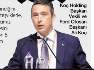
Koç Holding Başkan Vekili ve Ford Otosan Başkanı Ali Koç

bir teşvik sisteminin hazırlandığını açıkladı. İnaniyorum ki bu teşviklerle, bütünsel stratejilerle ihtiyacımız olan yeni bir yatırım hamlesini başlatabileceğiz. Sadece son 5 yılda 30 milyar liralık yatırım bile ülkemizin geleceğine olan inancımızın en büyük göstergesidir" dedi.