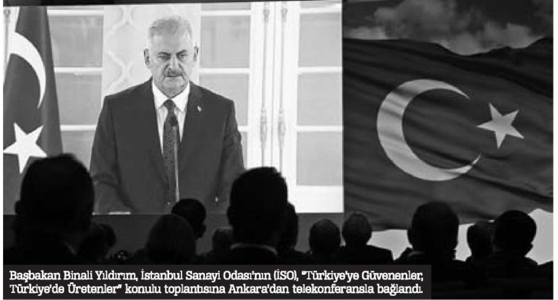
Başbakan Binali Yıldırım, İstanbul Sanayi Odası'nın (İSO), "Türkiye'ye Güvenenler, Türkiye'de Üretenler" konulu toplantısına Ankara'dan telekonferansla bağlandı.

■ 15 Temmuz gecesinde Türkiye büyük bir uçurumun eşiğinden döndü. Ülkemizin geleceğine kastedenler, demokrasisini yok etmeye çalışanlar, Gazi Meclisimizi bombalamaktan bile çekinmeyen alçaklar, eğer muvaffak olsalardı, bugün başka bir Türkiye'yi konuşuyorduk. Darbeyle yönetimi ele geçirilmiş, milli irade ortadan kaldırılmış ve dünya gelişen ülkeler liginden düşmüş, 3. dünya ülkeleri arasında bir Türkiye'yi konuşacaktık. ■ Ekonomik gelişmenin olmazsa olmazı