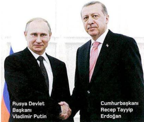
Rusya Devlet Başkanı Vladimir Putin

İş dünyasının da gözü ayardır bu görüşmedeydi. Rusya ile yaşanan krizin her iki tarafa büyük zarar verdiğini savunan iş alemi, şimdi gelecek adına daha umutlu. Hazır giyimden turizme, tarımdan enerjiye birçok sektör ayardır yaşanan kayıpların ancak birkaç yılda telafi edilebileceğini düşünüyor.