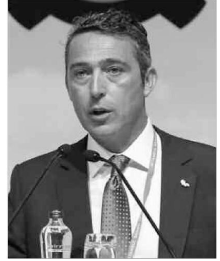
Koç Holding Yönetim Kurulu Başkan Vekili Ali Koç

KOÇ HOLDİNG YÖNETİM KURULU BAŞKAN VEKİLİ ALİ KOÇ, "SON BEŞ YILDA YAPTIĞIMIZ 30 MİLYAR TL'LİK YATIRIM, ÜLKEMİZİN GELECEĞİNE DUYDUĞUMUZ GÜVENİN GÖSTERGESİ" DEDİ.