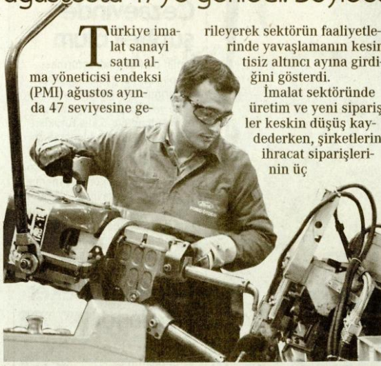
İmalat sanayi, 2009'dan bu yana en düşük seviyede.