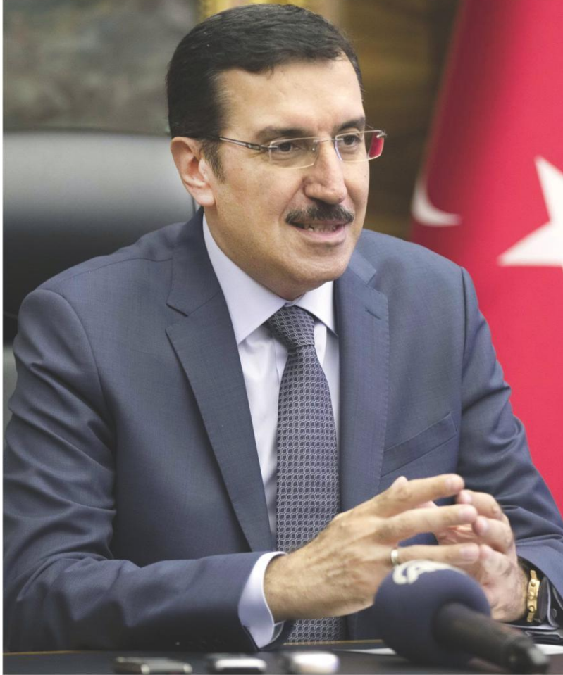
Kredi derecelendirme kuruluşlarının Türkiye'ye karşı yanıltıcı kararlar aldığına işaret eden Bülent Tüfenkci, milletin daha fazla üretmek için çaba sarf ettiğini söyledi.

Ticaret Bakanı Tüfenkci, 2016'nın son çeyreğinden itibaren büyüme trendine gireceğimizi belirterek, "Olumsuzluklar ve beklentilere rağmen 2017'de yüzde 5'lik büyümeyi yakalayacağız. 2017'nin 2016'dan daha iyi geçeceği muhakkak" dedi.