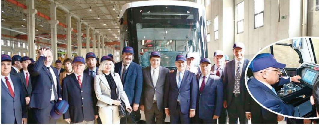
TİM Başkanı Mehmet Büyükekşi, ihracat rakamlarını Bursa'da Durmazlar Makina üretim tesisinde açıkladı. Büyükekşi basın toplantısının yeni tamamlanan tramvayda test sürüşü yaptı.

İhracatta 4 ay önce başlayan artış eğilimi sürüyor. Ocaktaki yüzde 18'lik artışın ardından ihracat 1 iş gününün eksik olduğu şubatta da yüzde 5.1 arttı.