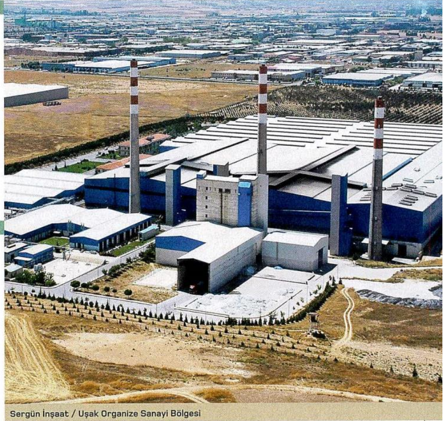
Sergün İnşaat / Uşak Organize Sanayi Bölgesi

Hükümet, Cazibe Merkezleri Programı ve Kredi Garanti Fonu gibi teşvik ve tedbirlerle ekonomiyi yeniden hızlandırmayı amaçlarken, İs-