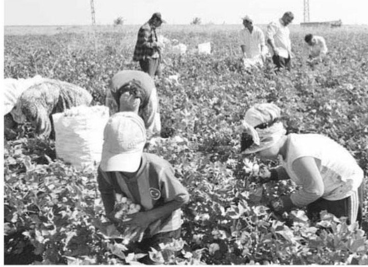
Ankara Sanayi Odası koordinatörlüğünde, Istanbul Sanayi Odası ve Adana Sanayi Odası ortaklığıyla saha çalışması yapıldı.