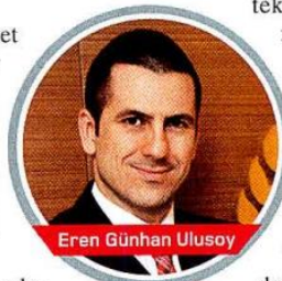
Eren Günhan Ulusoy