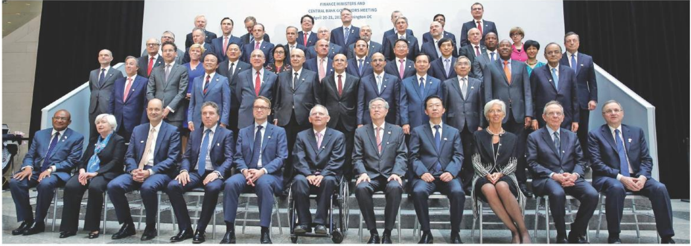
Washington'daki IMF-Dünya Bankası Bahar Toplantıları'nda Türkiye'yi Başbakan Yardımcısı Mehmet Şimşek, Maliye Bakanı Naci Ağbal ve Merkez Bankası Başkanı Murat Çetinkaya temsil etti.