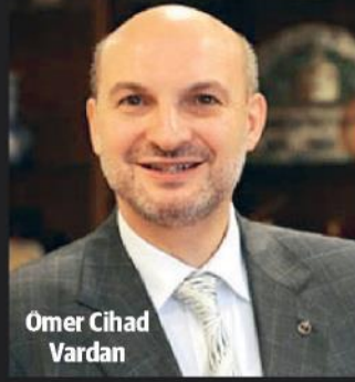
Ömer Cihad Vardan

İ ş dünyasının temsilcileri referandum sonrası belirsizliğin ortadan kalktığını belirterek reformlara odaklanma zamanı geldiğini söyledi. Dış Ekonomik İlişkiler Kurulu (DEİK) Başkanı Ömer Cihad Vardan, Türkiye'nin iç ve dış etkenler nedeniyle son yıllarda ortaya çıkan çeşitli badireleri atlarmaya çalışırken, referandumla birlikte önemli bir dönemi daha geride bıraktığını belirterek, referandumun ardından ekonomilerin hoşlanmadığı belirsizliklerin de ortadan kalktığını söyledi. Hükümetin çalışmalarında ilk önceliği ekonomiye vermesini arzu ettiklerini belirten Vardan, reformların başında dış bağımlılıklardan kurtulmak geldiğini kaydetti. Vardan, yenilenebilir enerjide hatta enerjinin her bir alanında atılım yapmaya ihtiyacı olduğunu söyledi. Bürokrasinin azaltılması ve verimliliğin artırılması da istendi.