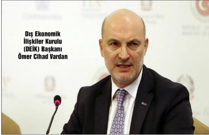
Dış Ekonomik İlişkiler Kurulu (DEİK) Başkanı Ömer Cihad Vardan

"Artık ekonomiye ilişkin seçimlere yoğunlaşılmalı"