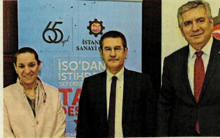
Istanbul Sanayi Odası (ISO) Nisan ayı meclis toplantısına katılan (soldan) Kale Grubu Başkanı Zeynep Bodur Okyay, Başbakan Yardımcısı Nurettin Canikli ve ISO Başkanı Erdal Bahçivan birlikte fotoğraf çekti.

Enflasyon, faiz ve işsizlik rakamlarını yılsonuna kadar tek haneye çekeceklerini ifade eden Nurettin Canikli şunları söyledi: "Bu yıl içerisinde kamu ürünlerine zam yapılmayacak. Ayrıca hem finansman çeşitliliğini artırmak hem de yeni fon kaynağı yaratmak amacıyla yeni bir enstrüman üzerinde çalışıyoruz. Bunun ismine 'banka senedi' dedik. Böylece bankalar, varlıklarını menkul kıymet olarak ihraç edip para bulabilecek."