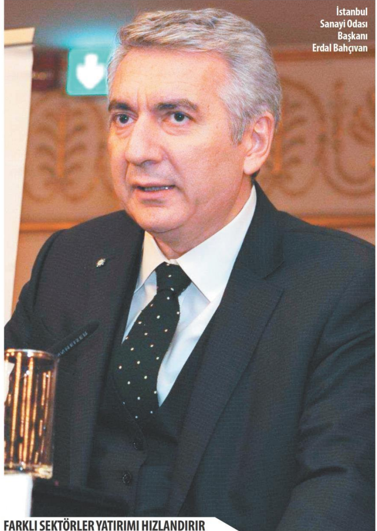
İstanbul Sanayi Odası Başkanı Erdal Bahçivan